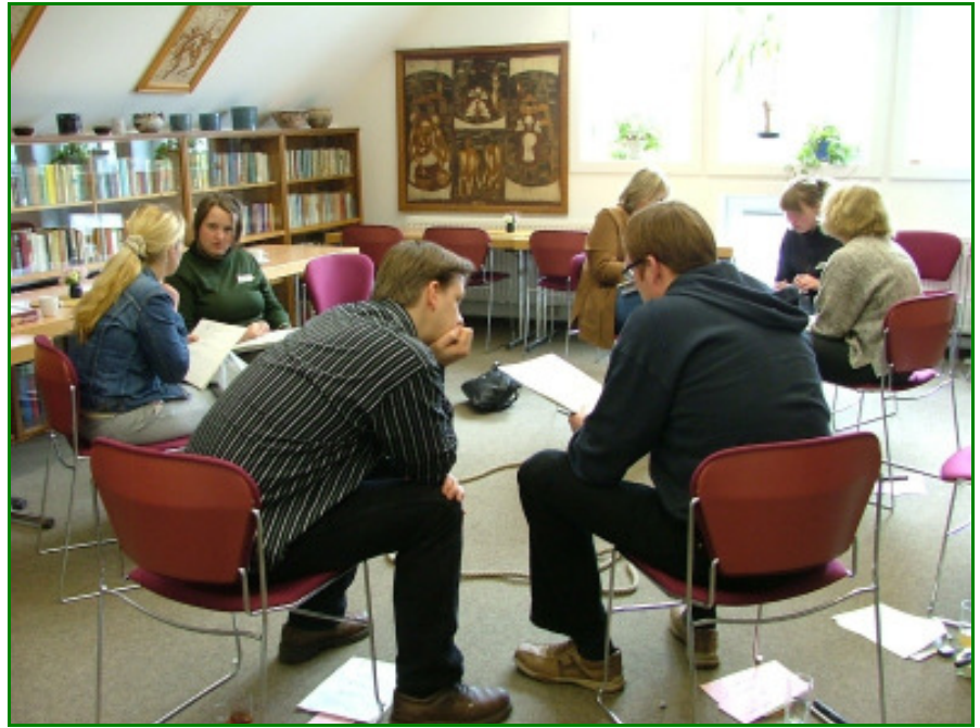
Blick ins aktuelle Seminar "Einführung in die politische Rhetorik"