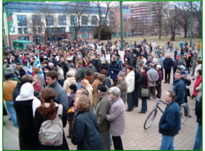
Viele Bündnisgrüne beteiligten sich an den Anti-Rechts-Aktionen – so in Magdeburg bei der Kehraktion (links). In Dessau waren die Bündnisgrünen die Mitinitiatoren der Kundgebung.