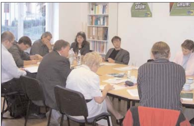
Momentaufnahme aus einem Treffen der Landesfachgruppe Bildung.

Die Landesfachgruppen (LFG) leisten programmatische und inhaltliche Arbeit. Fachleute aus unseren Reihen arbeiten mit Fachverbänden, Initiativen und wissenschaftlichen Einrichtungen zusam-