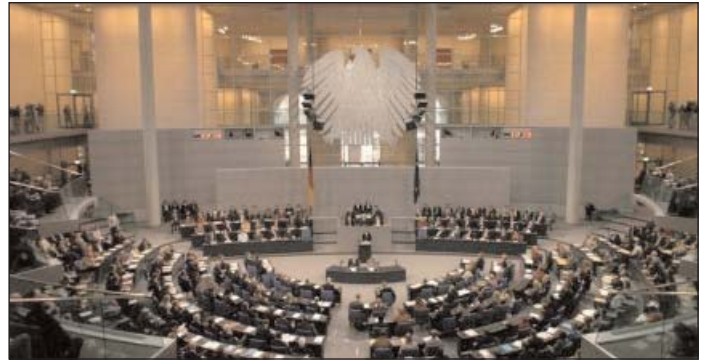
Blick ins Plenum.